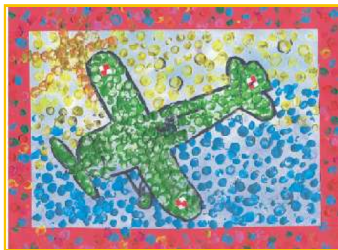
Praca Łukasza Osiennika, ucznia kl. III b SP nr 3 w Bielsku Podlaskim, nagrodzona w konkursie „Moja wakacyjna przygoda”