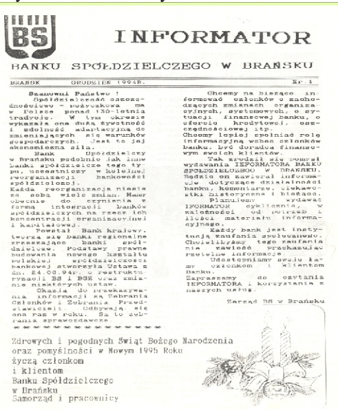
Pierwsza strona 1 numeru Informatora BS z 1994r.

Bank w okresie wydawania Informatora od 1994 roku, zmienił swój wygląd zewnętrzny i wewnętrzny, ale przede wszystkim zwiększył rozmiary swojej działalności. Suma bilansowa na 31 grudnia 1994r. wynosiła 5,1 mln zł. (z uwzględnieniem denominacji) a na 28 lutego 2007r.