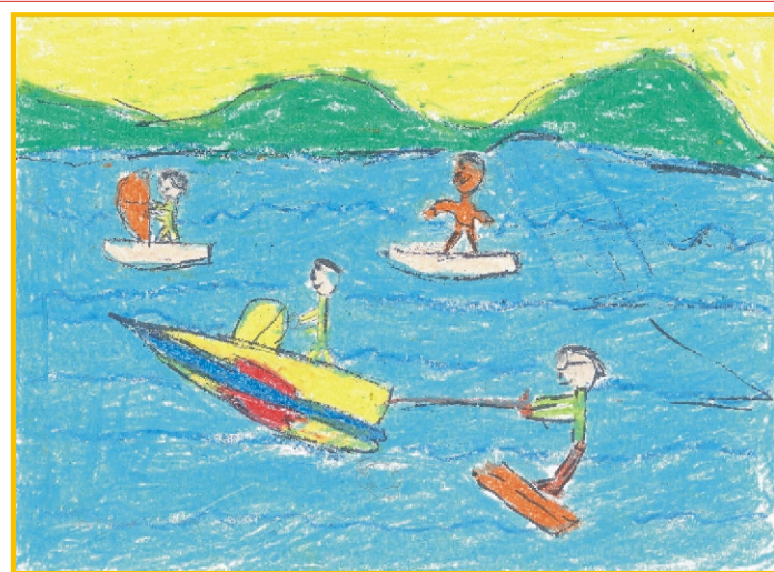
Praca Julianny Podolec, uczennicy kl. III b SP nr 3 w Bielsku Podlaskim, wyróżniona w konkursie „Moja wakacyjna przygoda”